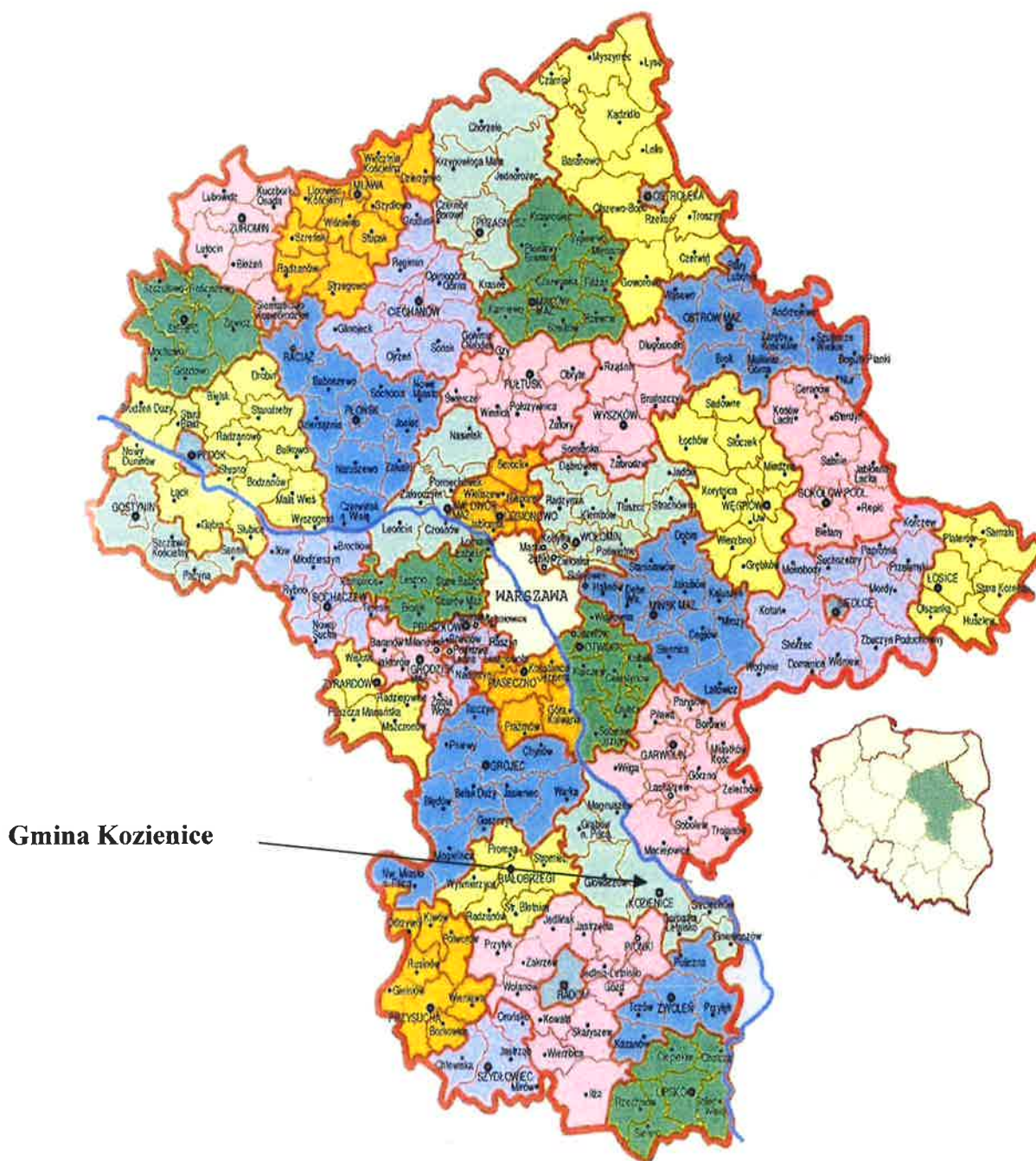
Położenie gminy Kozienice w województwie mazowieckim

Wspólnota samorządowa – Gmina Kozienice – położona jest w południowo-wschodniej części województwa mazowieckiego i graniczy z gminami: Sieciechów, Garbatka, Pionki, Głowaczów, Magnuszew, Maciejowice. Liczba ludności w mieście i gminie – 31.679 osób (na 30.06.2008 r.).