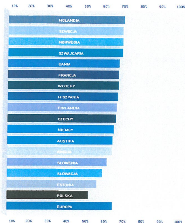
Ryc. 2. PIĘCIOLETNIE WZGLĘDNE PRZEŻYCIA Kobiet chorych na raka szyjki macicy. EUROPA 1990–1994

Rak szyjki macicy w skali całego świata jest drugim, co do częstości rakiem, który dotyka kobiety i drugą, co do częstości przyczyną ich zgonów z powodu chorób nowotworowych. Globalnie, co roku notuje się ok. 500 000 nowych zachorowań, a około 300 000 kobiet umiera z powodu raka szyjki macicy. Szacuje się, że na świecie liczba kobiet chorych na raka szyjki macicy sięga 1,4 miliona. W Polsce zapada na ten typ nowotworu ponad 3600 kobiet rocznie, z czego umiera, co roku niemal 2000. Jest to jeden z najwyższych wskaźników umieralności w Europie (9,4/100 000 kobiet). Warto tu zauważyć, że o ile wskaźnik zachorowalności na raka szyjki macicy w Polsce nie różni się od odnotowanego w innych krajach Europy, o tyle odsetek kobiet przeżywający 5 lat po rozpoznaniu tego nowotworu należy do najniższych w Europie i nie przekracza 50% (ryc. 2).