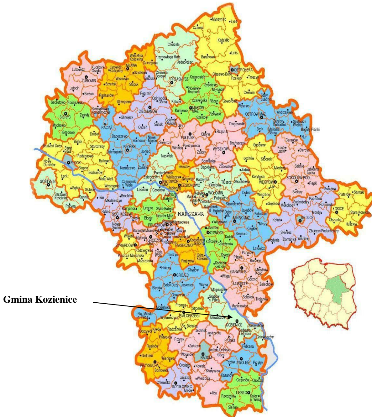
Położenie gminy Kozienice w województwie mazowieckim

Wspólnota samorządowa – Gmina Kozienice – położona jest w południowo wschodniej części województwa mazowieckiego i graniczy z gminami: Sieciechów, Garbatka, Pionki, Głowaczów, Magnuszew, Maciejowice. Liczba ludności w mieście i gminie – 31.679 osób (na 30.06.2008 r.).