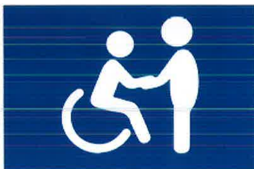
ASYSTENT OSOBISTY OSOBY NIEPEŁNOSPRAWNEJ

Celem programu jest zapewnienie wsparcia w wykonywaniu codziennych czynności oraz funkcjonowania w życiu społecznym osób z niepełnosprawnością i prowadzenia bardziej samodzielnego i aktywnego życia. Asystencji udzielają wsparcia zarówno w miejscu zamieszkania jak i poza nim. Osoby z niepełnosprawnością mogą odbywać wycieczki, bywać w kinie i w sklepach. Asystenci towarzyszą im na treningach i rehabilitacji oraz w codziennym funkcjonowaniu.