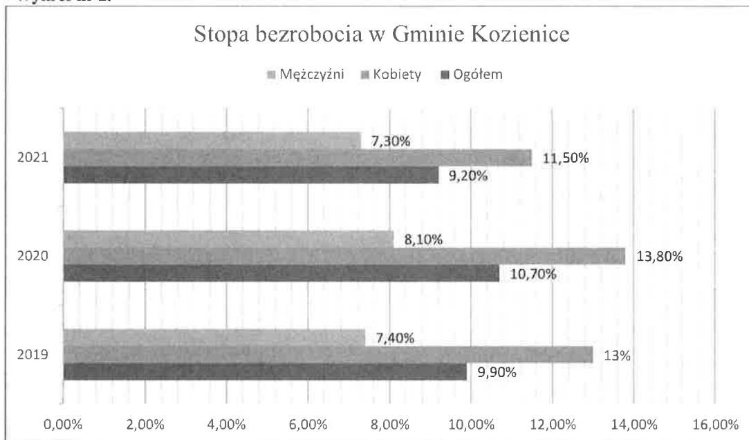
Wykres nr 2.