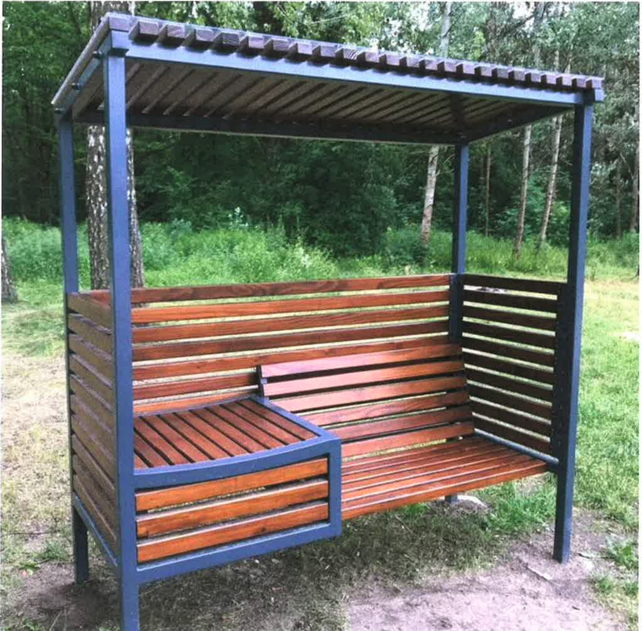
Zdj. 1 – ławka dla matek karmiących