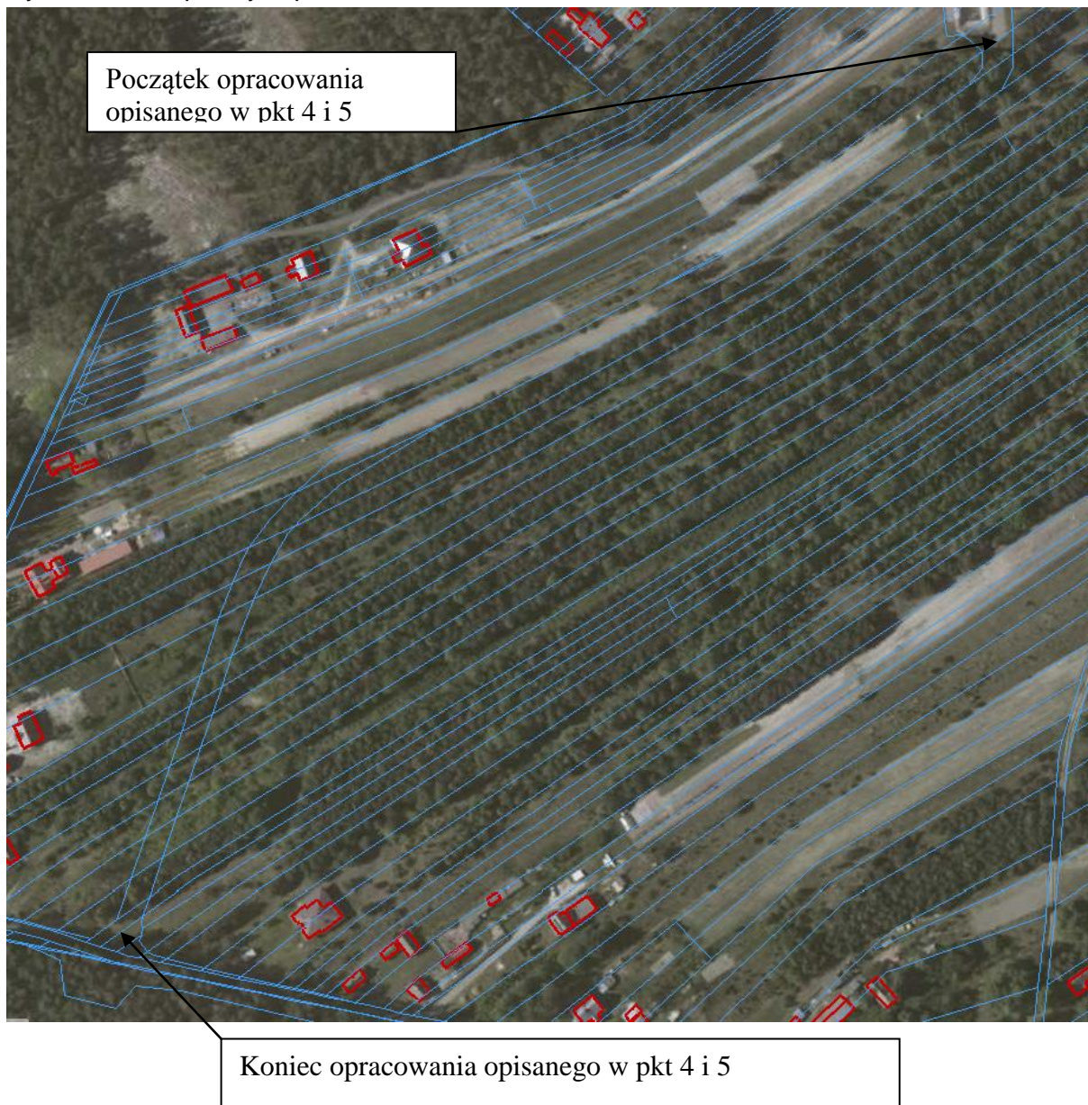
Rys 1 Zakres opisany w pkt 4 i 5