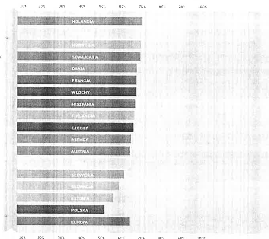
Ryc. 2 PIĘCIOLETNIE WZGLĘDNE PRZEŻYCIA Kobiet CHORYCH NA RAKA SZYJKI MACICY. EUROPA 1990–1994

Rak szyjki macicy: w skali całego świata jest drugim, co do częstości rakiem, który dotyka kobiety i drugą, co do częstości przyczyną ich zgonów z powodu chorób nowotworowych. Globalnie, co roku notuje się ok. 500 000 nowych zachorowań, a około 300 000 kobiet umiera z powodu raka szyjki macicy. Szacuje się, że na świecie liczba kobiet chorych na raka szyjki macicy sięga 1,4 miliona. W Polsce zapada na ten typ nowotworu ponad 3600 kobiet rocznie, z czego umiera, co roku niemal 2000. Jest to jeden z najwyższych wskaźników umieralności w Europie (9,4/100 000 kobiet). Warto tu zauważyć, że o ile wskaźnik zachorowalności na raka szyjki macicy w Polsce nie różni się od odnotowanego w innych krajach Europy, o tyle odsetek kobiet przeżywający 5 lat po rozpoznaniu tego nowotworu należy do najniższych w Europie i nie przekracza 50% (ryc. 2).